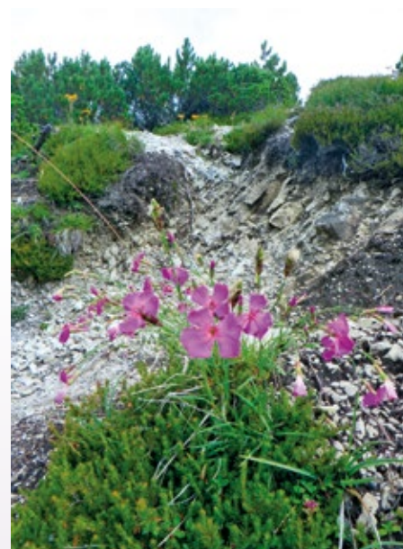
Na poti na Trupejevo poldne

vsaj deževalo ni. Za zadnjimi hišami na Srednjem Vrhu se kolovoz, ki vodi ob potoku Jerman, kar strmo dviga proti lovski koči nad predelom imenovanim Železnica, do koder se lahko prispe tudi po gozdni cesti iz smeri mejnega prehoda Korena. Pot se nato zmerno vzpenja po neizraziti dolinici proti sedlu med Trupeje-