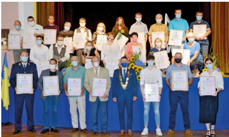
Letošnji prejemniki priznanj župana in plaket Občine Vodice