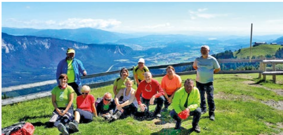
Na vrhu Tromeje

Samo teden za tem smo že sopihali na Dobrčo. Preko Bistriške in nato Lešanske planine smo se povzpeli na vrh in se po drugi poti spustili najprej do kočice in nato po grebenu nazaj do izhodišča. Srečevali smo številne pohodnike, ki so nasmejanih obrazov znova okušali radost pohodništva.