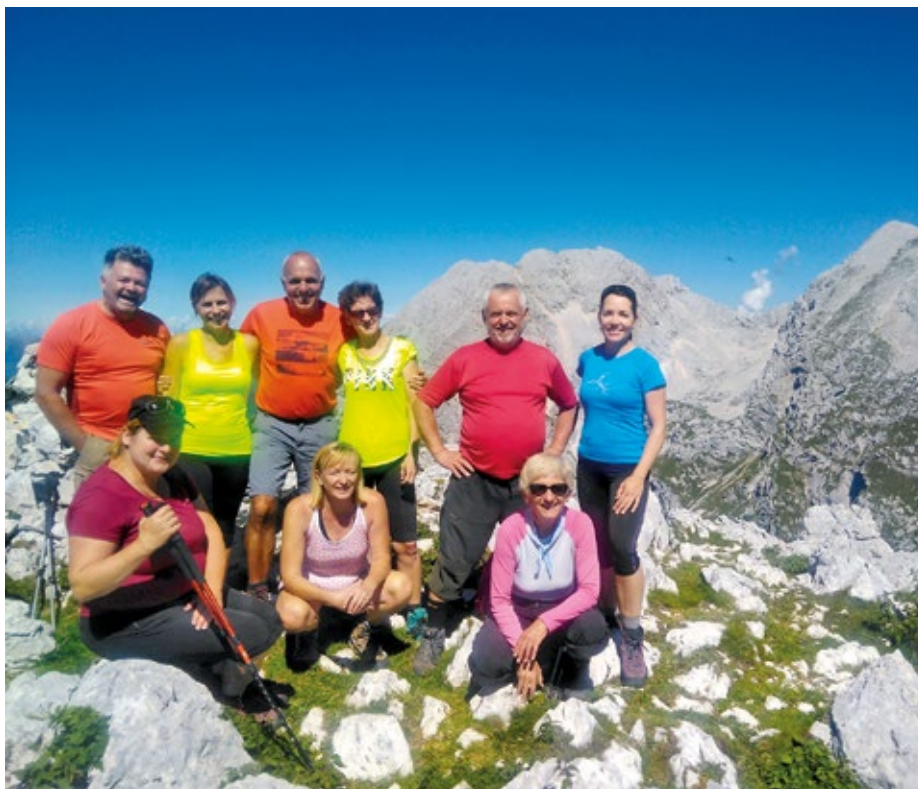
Kalški greben, v ozadju Kočna in Grintovec

Po mesecu odmora smo v avgustu šli na Kalški greben. Obetal se je lep dan in sončni vzhod smo pričakali že na Kriški planini. Vrhovi so čudovito zažareli, že v naslednjih nekaj minutah se je svetloba čarobno razlila čez travnike. Pred nami je bila dolga pot, zato smo pridno zakorakali po poti, ki nas je najprej pripeljala na Planino Koren. Tu smo si nekoliko oddahnili in jo nato še v senci mahnilni proti vrhu Korena. Pokazali so se najvišji vrhovi Kamniških Alp od Kočne, Grintovca, Štruce, Skute, do vseh treh Rink, Turske gore, Brane, Planjave in Ojstrice. Globoko pod nami se je v jutro prebujala dolina Kamniške Bistrice. A naš cilj je bil še daleč, z vrha Korena smo se spustili kar nekaj sto višinskih metrov in nato začeli dolgo pot po grebenu. Razgledi so bili ves čas čudoviti, družina dobro razpoložena in po petih urah hoje smo osvojili vrh Kalškega grebena. Tam nekje daleč smo videli Krvavec, kamor smo se morali ta dan vrniti, zato smo si na vrhu vzeli samo kratek čas za malico, se skupaj