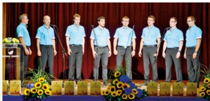
Matici iz Kulturnega društva Matije Koželja Utik so zapeli Gregorčičevo Pogled v nedolžno oko.