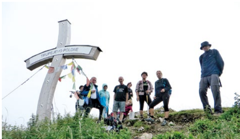
Skupinska slika ob znamenju na vrhu

Druga pot nas je vodila iz Vodice preko Lahovč in Cerkelj do Šenčurja, kjer smo si ob krajšem postanku privoščili kavni doping. Polni novih moči smo se odpeljali skozi Voklo, Smlednik in Pirniče do Šmartnega pod Šmarno goro, kjer smo si privoščili malico, da smo lažje zaključili z vožnjo v Vodichah.