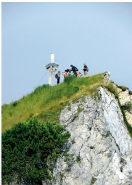
Do vrha ni več daleč, saj se že vidi križ na Trupejevem poldnevu

Avgusta smo po programu izpeljali dva izleta. V začetku meseca smo krenili iz Vodice preko Mengša in Radomelj do Kamnika, kjer smo si ob krajšem počitku privoščili jutranjo kavico in kakšno sladko pregreho. Okrepčani smo se preko Križa, Podboršta in Lahovč vrnili na izhodišče v Vodice.