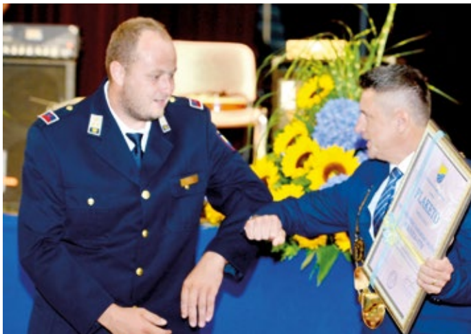
Prostovoljno gasilsko društvo Bukovica-Utik