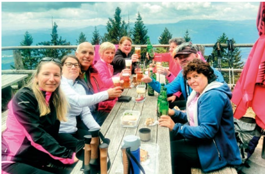
Zaslužena malica na Dobrči

Prvi izlet, ki smo ga po omilitvi ukrepov lahko izvedli, je bil šele v mesecu juniju, ko smo šli na Porezen. Z be-