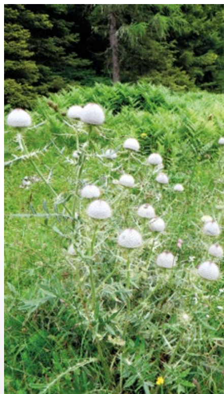
Bodeča jesenska lepota