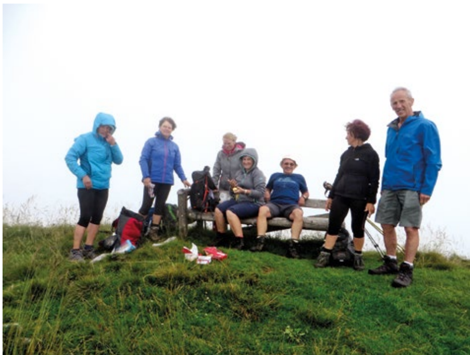
Kljub megli smo osvojili Vrh nad Škrbino

Teden dni kasneje smo se odpravili na primorsko stran, na hribe in planine nad Tolminom. Naš cilj je bil Vrh nad Škrbino . Letošnji prvi dvatisočak. Izhodišče je bila planina Kuk. Do nje smo se pripeljali po Poljanski dolini, preko Cerknega in Ljubinja pri Tolminu. Pred planino je lepo urejeno parkirišče, kjer smo pustili avtomobile in krenili do naslednje planine – planine Razor. Bolj ko smo se približevali vrhovom nad planino Razor, bolj oblačno je bilo nebo in vrhovi zaviti v meglo. Kljub oblačnemu vremenu je bilo zelo soparno in kmalu za kočjo na planini Razor, ko smo zagrizli v strmali proti vrhu, smo bili že lepo preznojeni. Pot je lepo speljana in tudi lepo označena, tako da bi se morali zelo potruditi, da bi zgrešili pot. Pot je zelo raznolika, saj je nekaj časa precej strma, se kmalu poravnava, nato se celo rahlo spušča, se znova vzpne in zmerno vzpenja čez pobočja porasla z ruševjem do razpotja, kjer se razcepi v dve smeri: na Škrbino in na Vrh