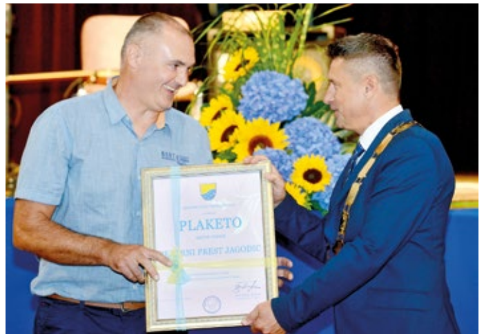
Pekarna prest Jagodic

Drugo plaketo Občine Vodice je prejela Pekarna prest Jagodic za 100 let ohranjanja tradicije prestarske obrti in promocijo občine Vodice.